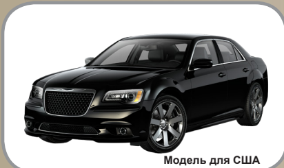
Модель для США